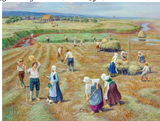
C'est plus d'un siècle d'âge d'or... avant la déchirure.