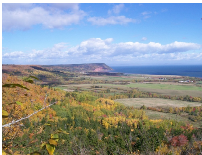
Région de Grand Pré, Port Royal, berceau de l'Acadie

C'est La Chaussée, un lieu d'origine et Archigny, lieu d'un certain retour... C'est cette histoire si discrète malgré sa grandeur.