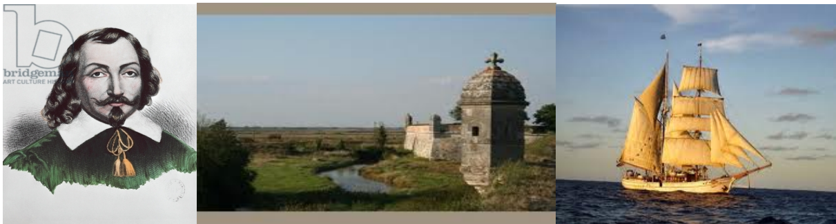
C'est Royan et Brouage d'où viennent les Champlain, Poutrincourt et DuGua-DeMonts; Ces pères de la civilisation française en Amérique.