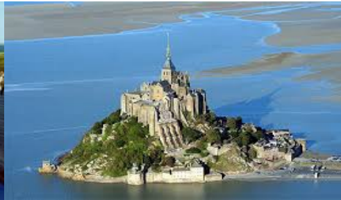
Le Mont Saint-Michel

Pour Carnac, c'est 6,000 ans dans le temps qu'il faut remonter.