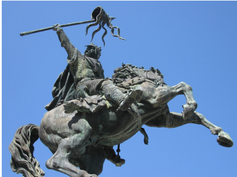
Guillaume le Conquérant

Ce sont des symboles incarnés par des personnages plus grands que nature et qui inspirent toujours tout autant depuis plusieurs siècles. ... des mythes qui n'ont plus d'âge, et pourtant... pour nous, ils demeurent nos références et nous sont chers.