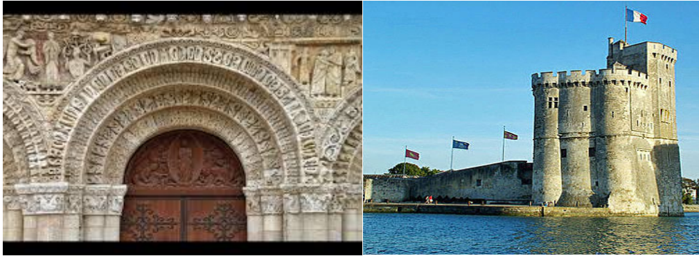
La Rochelle, grand lieu de partance vers l'Acadie!